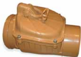
Clapet anti-retour : pratique et efficace

Ecolo soutient l'idée de la mise en place d'un service d'aide et de conseils techniques pour les Bruxellois désireux de se protéger des inondations