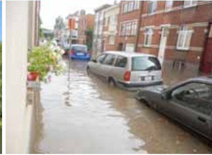
L'impact de l'imperméabilisation