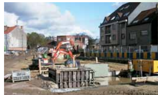
Construction d'un bassin d'orage chaussée de Stockel

Au gré des inondations du Val des Seigneurs, du quartier du Centre, de l'avenue du Manoir d'Anjou, de l'avenue des Grands Prix, de la rue du Bemel, etc., la construction de 5 bassins d'orage pendant ces 30 dernières années a permis d'endiguer certaines inondations récurrentes. Sont-ils pour autant la solution suffisante aux inondations? Non, car ils ne combattent pas le mal à sa source, à savoir l'imperméabilisation galopante du sol. En cinq décennies, notre commune a doublé l'imperméabilisation de son territoire, augmentant de manière considérable le volume des eaux de ruissellement. Dès lors, quel sens donner à ces investissements, si dans le même temps nous n'inversons pas la tendance? Nous plaçons donc pour que le financement et la réalisation de ces ouvrages soient couplés à la mise en œuvre par les autorités communales de mesures compensatoires souvent peu coûteuses (voir ci-contre : 10 recommandations portées par ECOLO pour nos communes).