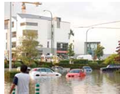
Inondation désastreuse au Shopping Center!

Septembre 2005, juillet 2006, octobre 2009. Lors d'orages violents, les inondations sont catastrophiques dans la vallée. Le boulevard de la Woluwe, la rue Voot