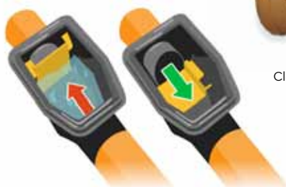
Le clapet arrête les eaux de refoulement (Documentation: UK Flood Barriers)