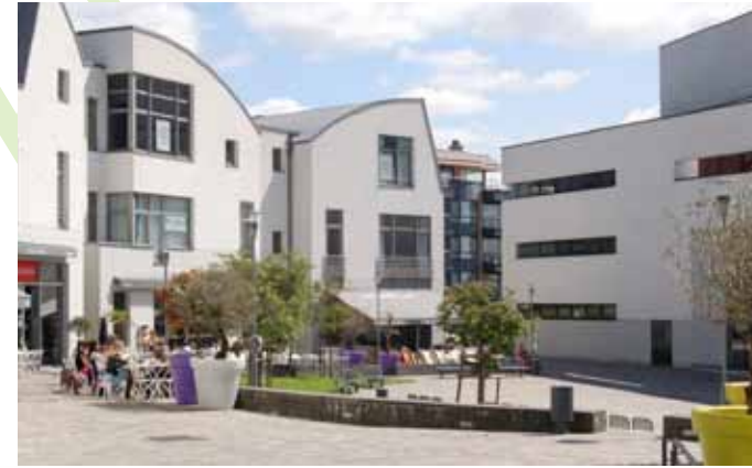
Wolubilis, imperméabilisation maximale