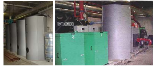
les ballons de stockage solaire (photo de gauche) les 2 cogénérateurs et la chaudière à condensation (photo de droite)